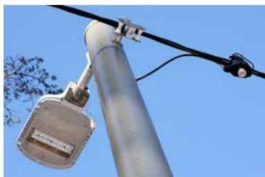
Armatyr med konsol direkt på stolpen

Armatyren skruvas med konsol direkt på stolpen och elförsörjningen sker med luftkabel mellan stolparna.