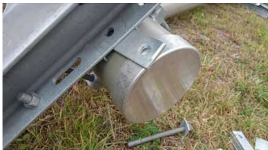
Distansbrickan monteras mellan stolpe och regel för att fjädrarna inte ska tryckas in i stolpen.

OBS! Vid användning av fjäderförsedda regler och fästen på Jerol kompositstolpe behövs en distansbricka. Distansbrickan förhindrar fjädrarna att trycka för djupt in i stolpen.