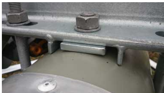
Distansbrickan förhindrar punktlaster och trycket fördelas jämt mellan distansbricka och fjädrar.