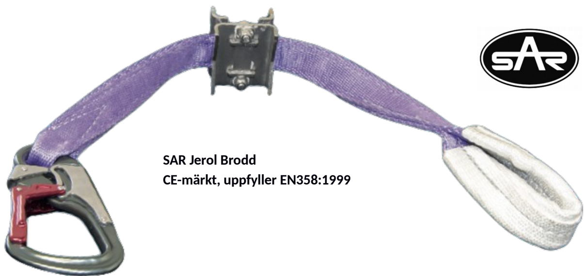
SAR Jerol Brodd CE-märkt, uppfyller EN358:1999